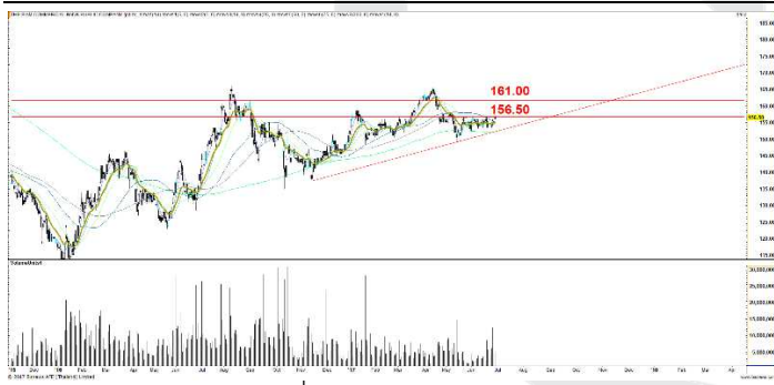
Fig 4 Technical Chart