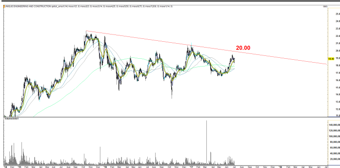
Fig 5 Technical Chart