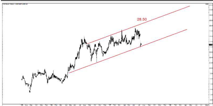
Fig 7 Technical Chart