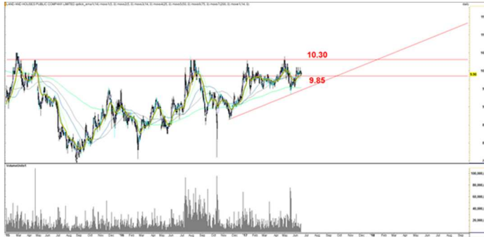
Fig 1 Technical Chart

LH11C1711A ซื้อที่ 0.50 บาท เป้าทำกำไรที่ 0.63 บาท