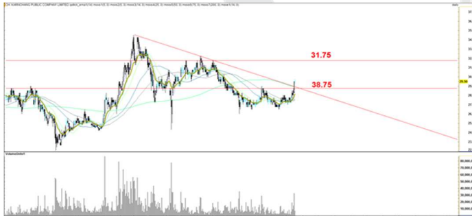
Fig 2 Technical Chart

CK11C1709A ซื้อที่ 0.30 บาท เป้าทำกำไรที่ 0.37 บาท