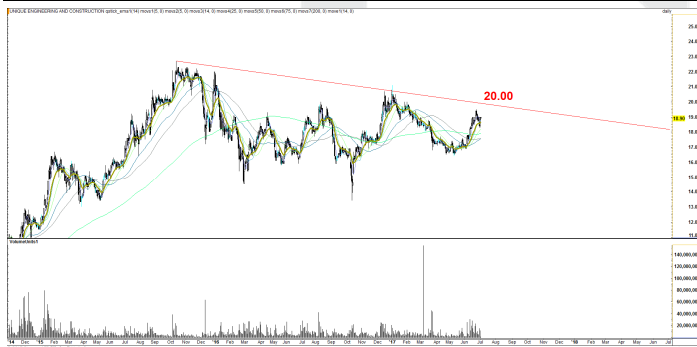
Fig 6 Technical Chart