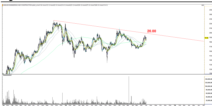
Fig 5 Technical Chart