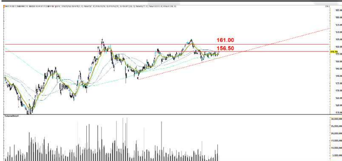
Fig 4 Technical Chart